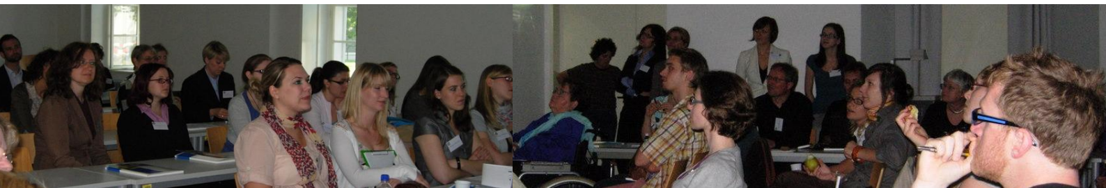
Und wie immer: das interessierte Publikum