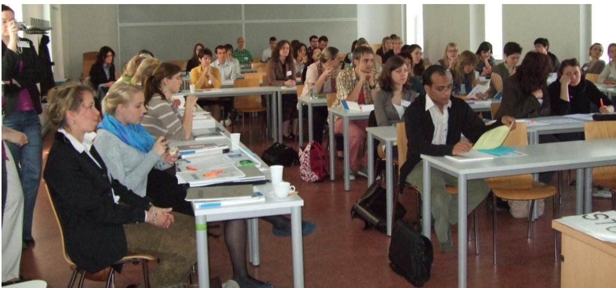
das interessierte Publikum